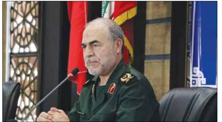
«سردار یدالله جوانی» معاون سیاسی سپاه پاسداران انقلاب اسلامی در نشست ویناری با حضور بیش از ۳۰۰ نفر از مسئولان کانون‌های بسیج اساتید

نقطه عطفی در تحولات منطقه و عرصه بین‌الملل باشد و ابعاد و زوایا و جنبه‌های راهبردی دارد که در این چند روز مطرح شده است.» وی افزود: «ما در یک جنگ شناختی هستیم و راهبرد مبارزه با جنگ شناختی جهاد تبیین است. این عملیات مطالبه عمومی برای تبیین و مجازات رژیم صهیونیستی بود که در بیانیه‌ها و اطلاعیه‌های سپاه هم آمد و در بیانات رهبری هم تأکیدهایی صورت گرفت.»